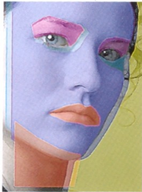
GIOVANNA GIOACHINO ROSSINI 5 AGOSTO 2008 PALAZZO MORPURGO UDINE