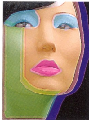
CLEOPATRA HECTOR BERLIOZ 5 AGOSTO 2008 PALAZZO MORPURGO UDINE