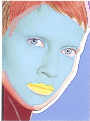
ANGELICA GIACOMO PUCCINI 29 LUGLIO 2008 PALAZZO MORPURGO UDINE