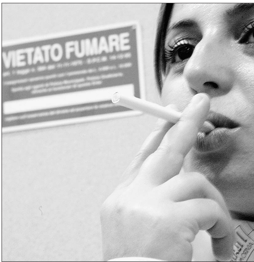
Il tabagismo è un vizio che può provocare malattie, anche letali, ai fumatori