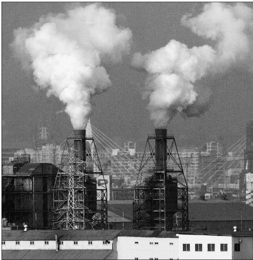
In una foto d'archivio, il fumo che esce imponente dalle ciminiere di alcune fabbriche a Tokio, in Giappone